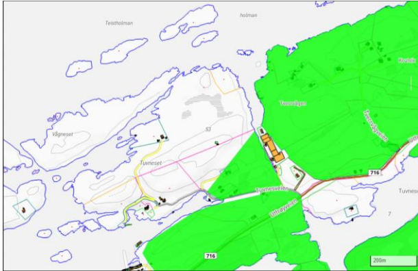
Areal som er registrert som beiteområde ihht kommunekart

Viser til kommuneplanens arealdel der området er avsatt til næringsformål/næringsutvikling. Dette er føringer som har vært styrende for tiltakshaver. Hvilken vektning gjøres i en slik sammenheng?