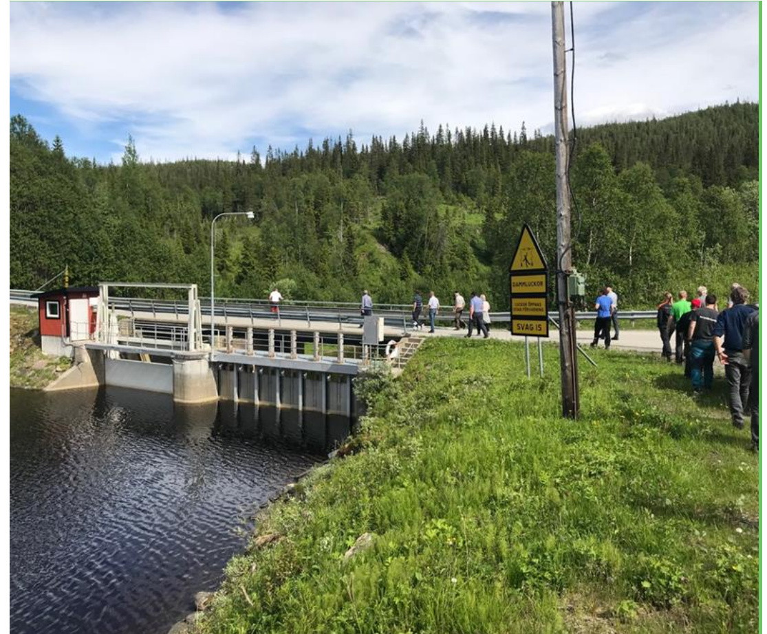
©Linvassälv, riksgrensen.